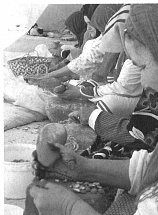
アルガンの実を砕いて油を含む核を取り出す作業。実は硬く細かい作業のため、機械化が困難で技術を要する。現地女性の仕事となっている。

【問合せ】Tel : 03-5475-7313 HP : http://www.nutrition-act.com/