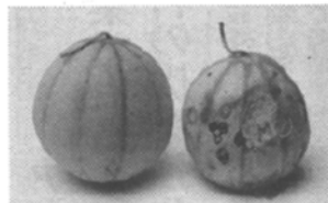
「特殊なメロン(左)と従来のメロン」(12日目)

「メロングリソディン」は、α-アウニオンとβ-アウニオンを抽出し、α-アウニオンとβ-アウニオンを結合させたもので、体内の3つの抗酸化酵素を誘導して抗酸化能を高める。フランス産メロンという好感度の高さから